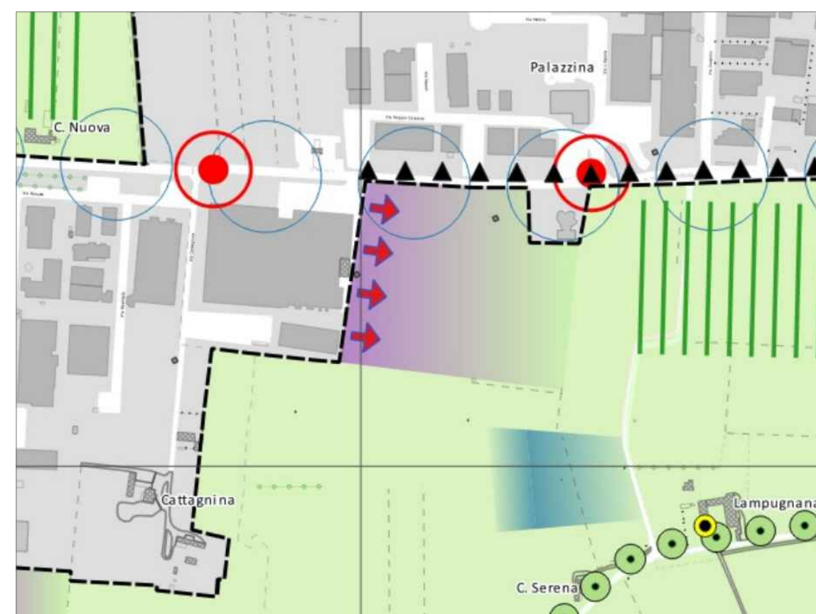
ESTRATTO DI PUG 1:5000