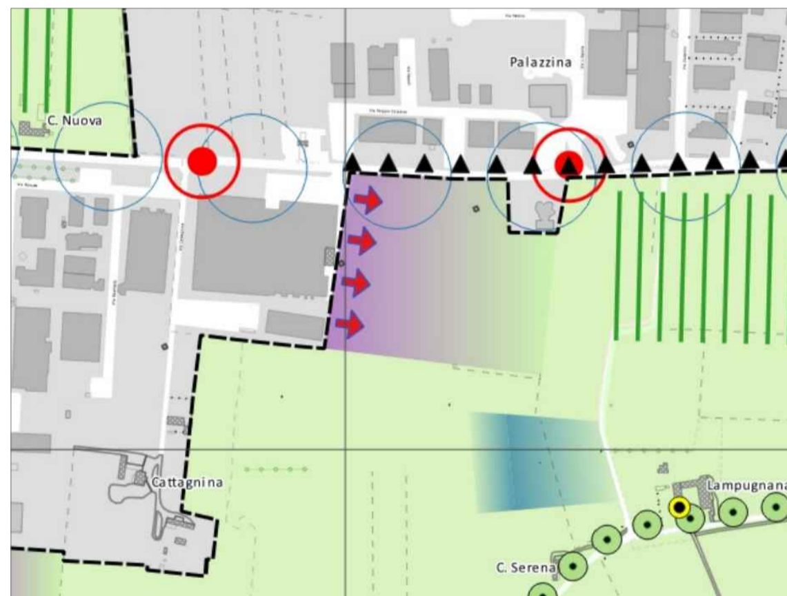
ESTRATTO DI PUG 1:5000