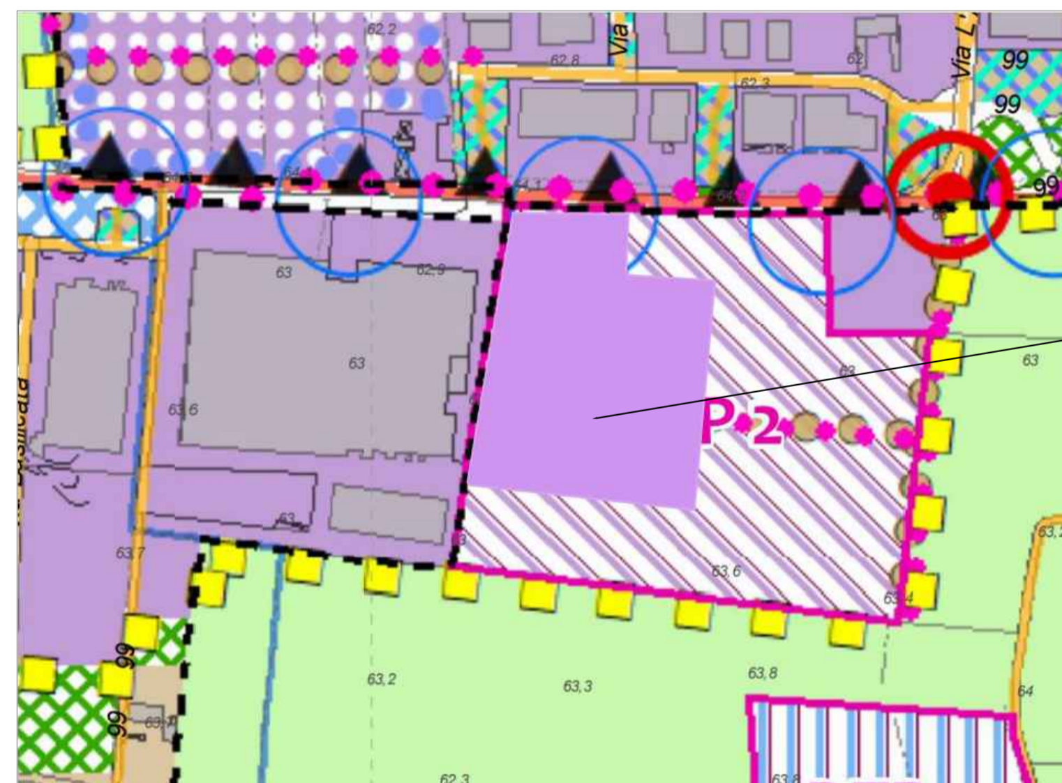
ESTRATTO DI PSC POST OPERE "ART 12 AMBITI SPECIALIZZATI PER ATTIVITA' PRODUTTIVE E COMM. SOVRACOMUNALI"